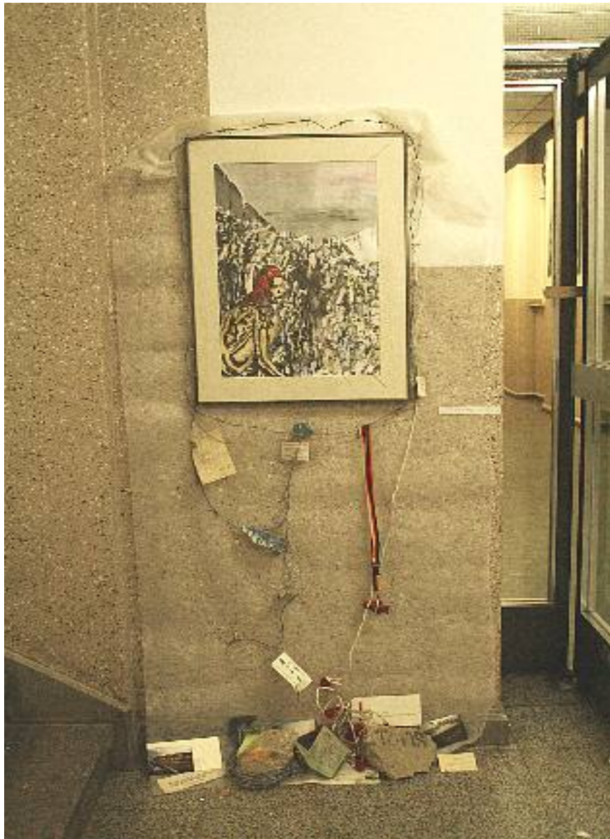
Matt Grau - Mauer/Ab/Fall Querschnitt 22 Berlin 2009