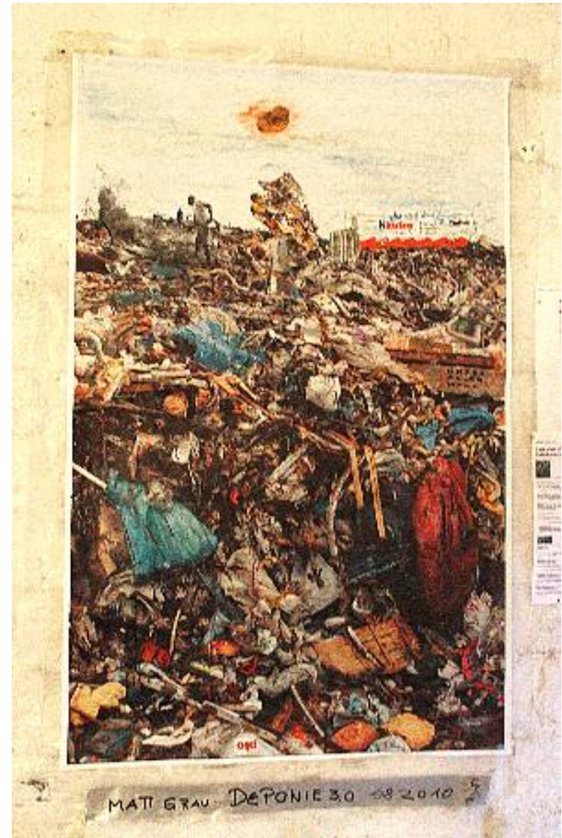
Matt Grau - Deponie 3.0 MocTA Berlin 2010