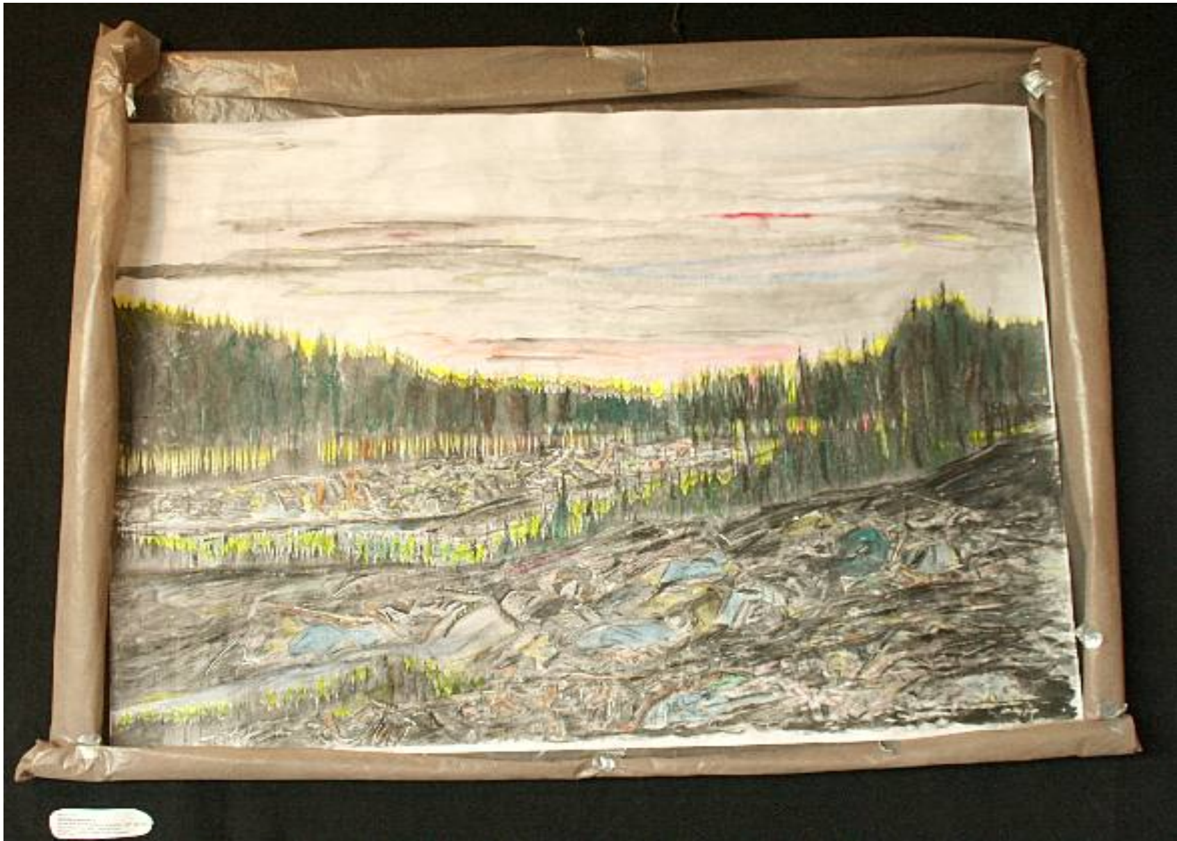
Matt Grau - Schwarzwasser 1 Tacheles Berlin 2009