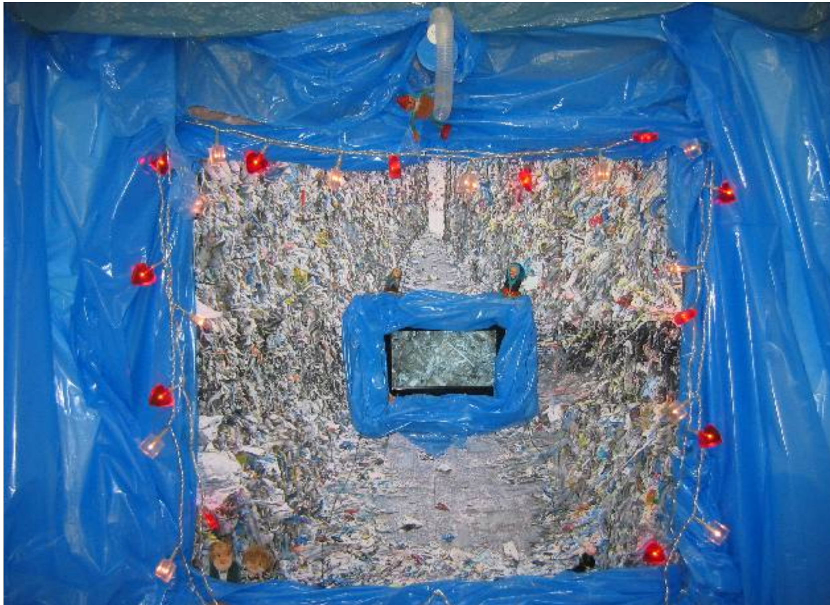
Matt Grau Im Zwischenreich 2008 (Detail) Installation Bethanien Berlin