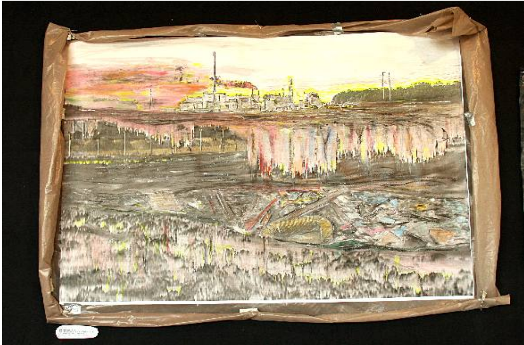
Matt Grau - Schwarzwasser 2 Tacheles Berlin 2009